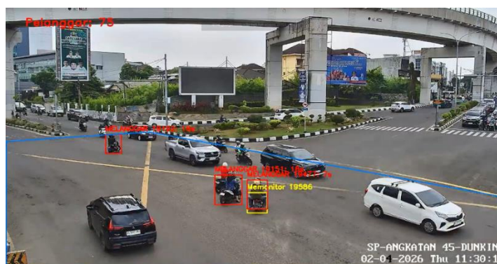
Gambar 4. Pelanggar Berhenti Lebih Dari 5 Detik

Sistem deteksi pelanggaran YBJ yang dikembangkan diuji coba menggunakan data video lalu lintas yang direkam di Simpang Angkatan 45, Palembang. Pengujian dilakukan pada total durasi video 32 menit 41 detik. Hasil keseluruhan sistem menunjukkan bahwa selama periode pengujian, sistem berhasil mendeteksi dan mencatat 168 kejadian pelanggaran YBJ, di mana setiap kejadian merepresentasikan satu kendaraan unik (berdasarkan ID) yang tercatat berhenti di dalam ROI selama lebih dari 5 detik seperti pada Gambar 4.