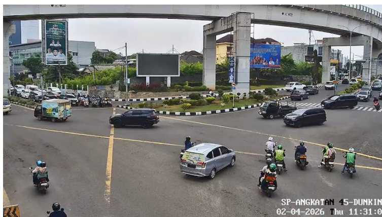
Gambar 2. Tangkapan Layar Video CCTV

Spesifikasi video yang direkam adalah resolusi 1920 \times 1080 piksel dengan kecepatan 30 \text{ frame per second} (fps). Total durasi video yang digunakan sebagai data pengujian adalah 32 menit 41 detik dalam rentang waktu jam sibuk, untuk memperoleh sampel pelanggaran yang representatif. Gambar 2 merupakan salah satu tangkapan layar dari video cctv yang didapatkan.