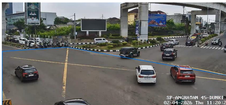
Gambar 3. Poligon ROI

Penentuan Region of Interest merupakan langkah krusial yang menentukan batas-batas area YBJ dalam sistem koordinat piksel pada frame video. ROI didefinisikan sebagai poligon yang koordinatnya diekstraksi secara manual dengan mengacu pada batas-batas marka kuning YBJ yang tampak pada frame video. Koordinat ROI yang digunakan dalam penelitian ini adalah: (x_1, y_1) = (420, 380) , (x_2, y_2) = (980, 380) , (x_3, y_3) = (1050, 680) , dan (x_4, y_4) = (350, 680) , membentuk trapesium (garis warna biru) yang merepresentasikan perspektif kamera terhadap area kotak kuning di permukaan jalan dapat dilihat pada Gambar 3.